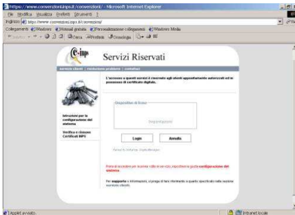
Pagina Web delle convenzioni

La figura che segue riporta la pagina Web dell'applicazione.